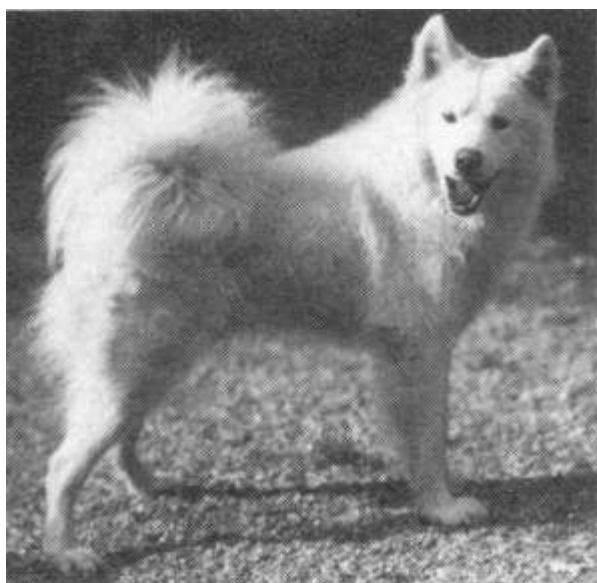
Duinrand's Bjorn, geb. 13 april 1927

Volgens mij zullen ze zich omdraaien in hun graf. Wanneer ik mij slechts beperk tot één van de Noordelijke rassen n.l. de Samojeed, dan is de metamorfose sinds een eeuw opzienbarend.