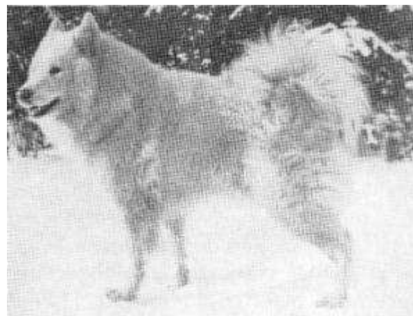
Farningham Ikon, de eerste import.