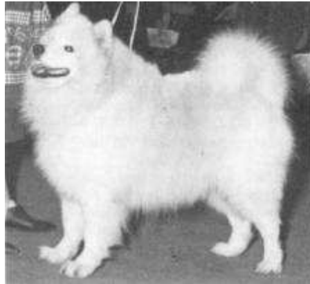
Beste hond op de Crufts

Wanneer je tegenwoordig op een hondententoonstelling rondkijkt is het alsof sommige hondenrassen van alle kanten besprongen worden door lieden, die bezig zijn -al of niet met voorbedachten rade -het oorspronkelijke rasbeeld geheel uit z'n verband te rukken. Van het oorspronkelijke blijft niets over. Tóch winnen deze honden vaak op de tentoonstellingen. Ze worden zelfs tot "beste van het ras" en soms zelfs tot "beste van de rasgroep" uitverkoren. Je snapt er niets van. Je vraagt je af; hoe het mogelijk is. Maar 't gebeurt!