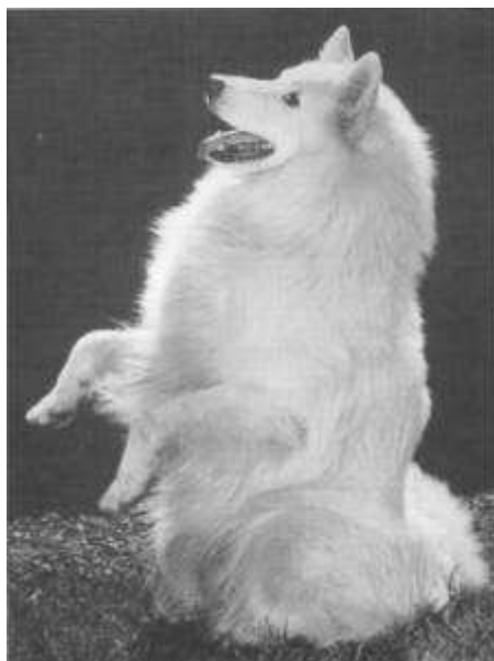
Kampioen Bertil, eig W..Clay