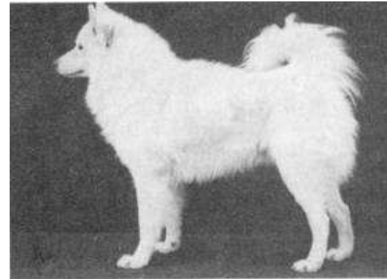
Lobi, import uit Rusland vóór 1971

In zo'n overwinningssroes lopen de eigenaren veelal naast hun schoenen van blijdschap en ijdelheid, wat te begrijpen is.