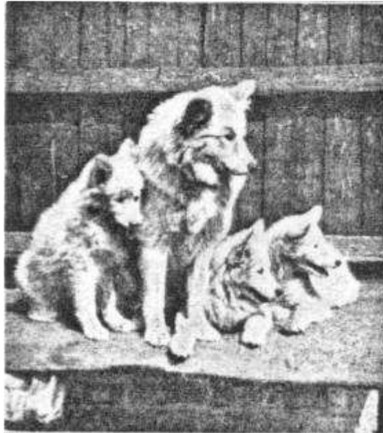
Samojeden geschonken aan capt. Scott